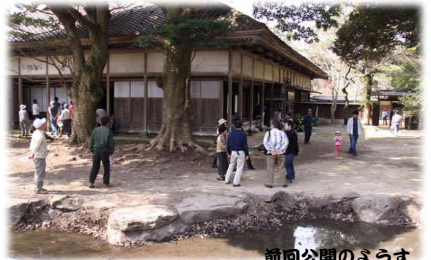
前回公開のようす

赤塚・中原邸の公開をします。「赤塚中原邸保存会」会員や有志による1年間の整備で昨年のようなすとは少しずつでも変わってきています。地域住民主体の会員の汗と赤塚の歴史文化の一端を感じ取っていただければ幸いです。